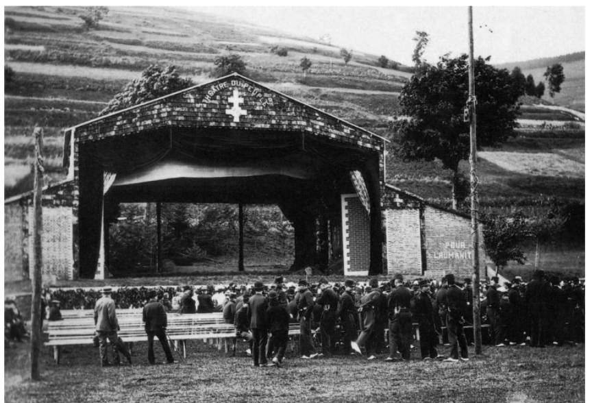
Théâtre du Peuple 1896, coll. part.

Les récits de voyages, expositions universelles, découvertes archéologiques et scientifiques... sont autant de vecteurs qui permettent à la population de découvrir d'autres cultures et de s'émerveiller de nouveaux horizons.