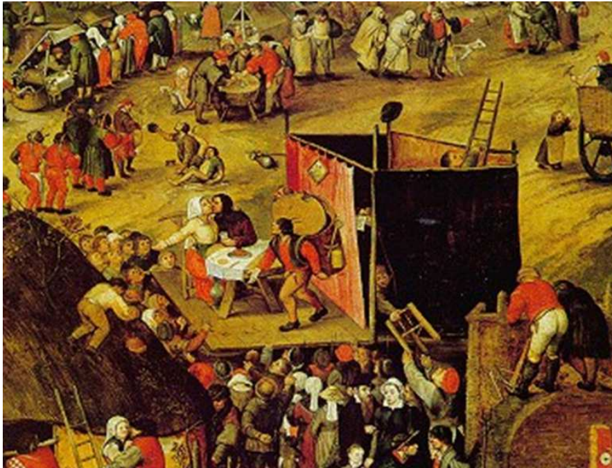
« La Foire paysanne », par Pieter Balten, XVIIe siècle - Représentation théâtrale de la fin du Moyen Âge.

Peu à peu, les représentations ont lieu à dates fixes, notamment à l'occasion des foires, rendez-vous des marchands, ou à l'occasion des fêtes religieuses et des événements publics. On voit alors apparaître des espaces consacrés au théâtre. Les troupes amateurs ou professionnelles peuvent se fixer au moins un temps dans un endroit précis.